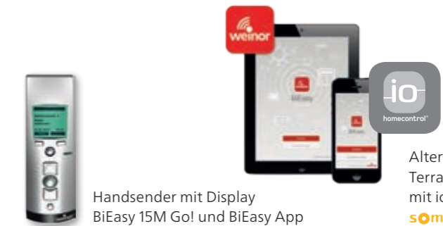
Handsender mit Display BiEasy 15M Go! und BiEasy App

Alternativ können Sie Ihre Terrasstechnik auch mit io-homecontrol® von somfy steuern.