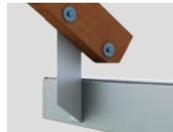
Dachsparrenmontage (bei überstehendem Dach)