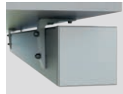
Deckenmontage (auf und unter dem Dach)

Neben der herkömmlichen Wandmontage lässt sich Kubata auch bei besonderen baulichen Voraussetzungen problemlos anbringen.