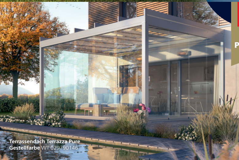
Terrassendach Terrazza Pure Gestellfarbe WT 029/90146

Glas-Terrassendach Terrazza Sempra Gestellfarbe RAL_7039 | Sottezza II Dessin 3-708 shell VertiTex II: Dessin Glasfaserscreen 7-201 pearl grey | white