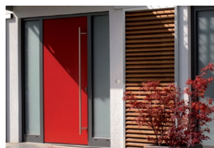
Haustüren – individuelle Ästhetik, kombiniert mit modernster Technik

Technische Änderungen sowie Sortiments-/Programmänderungen vorbehalten. Die Abbildungen können Sonderausstattungen zeigen, die nicht zum Standard-Lieferumfang gehören. Alle Texte und Abbildungen sind urheberrechtlich geschützt und Eigentum der jeweiligen Hersteller. Drucktechnisch bedingt sind Farbabweichungen möglich. Keine Haftung für Druckfehler.