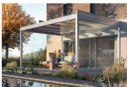
weinor Glasoase® – transparenter, lichtdurchfluteter Lebensraum