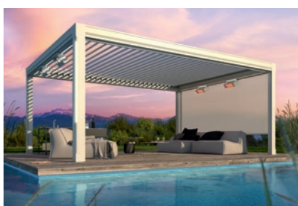
weinor Lamellendach Artares – Terrassenüberdachung der besonderen Art